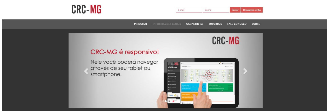
Tela de entrada do sistema

Para entrar na CRC-MG (Central de Registro Civil de Minas Gerais), basta acessar o link: registrocivilminas.org.br e realizar um cadastro informando alguns dados e criando um usuário e senha.